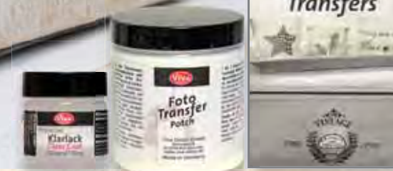
Foto-Transfer, ganz persönlich Photo transfer, customized Transfert de photos, complètement personnalisé Foto-Transfer del tutto personalizzato

Viva Decor GmbH Creative Color Company D-32108 Bad Salzuflen www.viva-decor.de