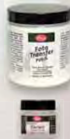
Foto-Transfer Potch: Laserausdrucke oder Laserkopien verwenden. Die gewählte Untergrund-Fläche und die Bildseite mit einem weichen Flachpinsel einstreichen und zügig aufeinander platzieren. Das Bild mit einem Raket o.ä. gleichmäßig andrücken. 24 Std. trocknen lassen oder 10 Min. trocken föhnen. Papierschicht mit einem Schwamm befeuchten und die aufgeweichten Papierfasern wegreiben.

Nach dem Trocknen mit Viva-Decor Premium Klarlack überlackieren.