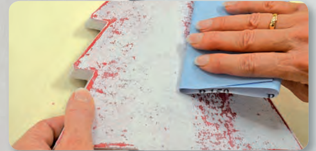
Technik, Technique, Technique, Tecnica